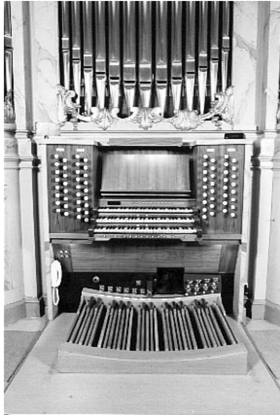
Det moderna spelbordet