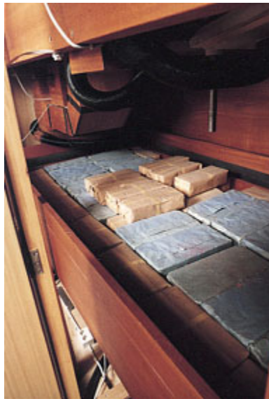
Luftmagasin i nya orgeln

"The beautiful organ at the Hedvig Eleonora church is one of the most successful eclectic organs i have ever heard. It combines classical clarity with enormous romantic warmth, 18th century solo timbres with 19th century ones, very fully developed principal choruses yet a huge romantic tutti.", Organist's Review