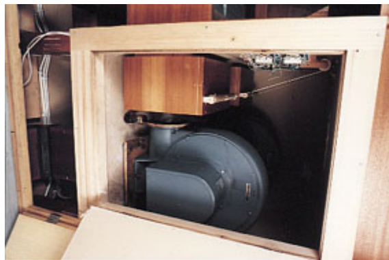
Orgelfläkten i nya orgeln

I september 1976 invigdes kyrkans stora orgel. Ur orgelhistorisk synpunkt är det en kort tid sedan. Ett gediget och väl underhållet instrument kan fungera i 50, 100 eller flera hundra år. Anledningen till att en orgel byts ut är ofta att den anses som musikaliskt otidsenlig, inte att den blivit utsliten och omöjlig att renovera. Under de gångna 20 åren har orgeln i Hedvig Eleonora kyrka intagit en viktig position i vårt lands moderna orgelbestånd, inte minst som ett lyckat exempel på en syntes av gammalt och nytt klangmaterial, gynnat av en synnerligen god akustik.