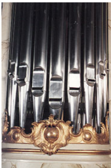
Närbild av orgelfasaden

Den nuvarande orgeln är ett flexibelt instrument med både klassiska och romantiska drag. En viss fransk karaktär finns i såväl disposition som klang. Tekniskt sett är Grönlundsorgeln osedvanligt gedigen och har en behaglig och precis speltouche. Kyrkans goda akustik för orgelklang är, som tidigare nämnts, en mycket gynnsam faktor. Ingenting i orgelvärlden är dock helt fulländat, och därför har under årens lopp vissa smärre förändringar i disposition och intonation vidtagits. Ett nytt, datorstyrt kombinationssystem installerades 1995: de tidigare sex fria kombinationerna (= sex olika valfria registersammanställningar) ersattes med inte mindre än 6400 kombinationer. Detta system underlättar den praktiska hanteringen av instrumentet i oerhört hög grad.